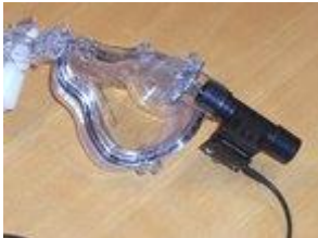
Mängden luft per andetag